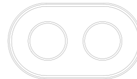
175 x 100 x 12 mm