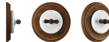
PORCELAIN & OLD WOOD