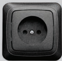
JKL 10-004 - 01 A/J Įleistinis kištukinis lizdas, be rėmelio Розетка скрытой установки