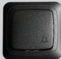
ĮESJ1 10-001 - 01 A/J ĮESJ1 10-002 - 01 A/J (su pašvietimu/c подсветкой) Įleistinis elektros skambučio mygtukas, be rėmelio Кнопка звонковая скрытой установки