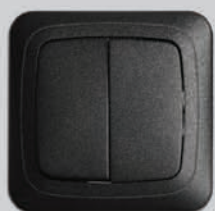
ĮJ 5 10-003 - 01 A/J ĮJ 5 10-004 - 01 A/J (su pašvietimu/c подсветкой) Įleistinis dviejų klavišų jungiklis, be rėmelio Выключатель двухклавишный скрытой установки