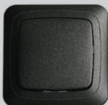
ĮJ 1 10-003 - 01 A/J ĮJ 1 10-004 - 01 A/J (su pašvietimu/c подсветкой) Įleistinis vieno klavišo jungiklis, be rėmelio Выключатель одноклавишный скрытой установки