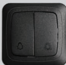
ĮASJ5 10-001 - 01 A/J ĮASJ5 10-002 - 01 A/J (su pašvietimu/c подсветкой) Įleistinis elektros jungiklis „šviesa+skambutis“, be rėmelio Выключатель «свет+звонок» скрытой установки