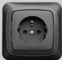
JKL 16 - 015 - 01 A/J Įleistinis kištukinis lizdas su įžeminimu, be rėmelio Розетка скрытой установки с заземлением