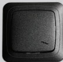
JP6 10-001 - 01 A/J JP6 10-002 - 01 A/J (su pašvietimu/c подсветкой) Įleistinis perjungiklis, be rėmelio Переключатель скрытой установки