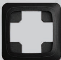
K - 14 - 135-01 A/J K - 14 - 135-02 A/J K - 14 - 135-03 A/J K - 14 - 135-04 A/J K - 14 - 135-05 A/J Rėmelis 1,2,3,4,5 vietų Рамка 1,2,3,4,5 мест