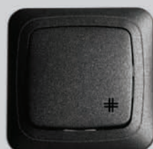
JKP6 10-001 - 01 A/J JKP6 10-002 - 01 A/J (su pašvietimu/c подсветкой) Įleistinis kryžminis perjungiklis, be rėmelio Переключатель перекрёстный скрытой установки