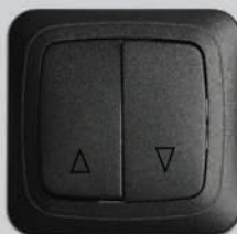
ĮJŽ 10-001 - 01 A/J Įleistinis jungiklis žaliuzėms, vartams, be rėmelio Выключатель для жалюзи и ворот скрытой установки

! Turime spec. pasiūlymų montuotojams - elektrikams (dalinis surinkimo gaminiai) itin geromis kainomis. ! Особое предложение монтажникам-электрикам (изделия частичной сборки) по выгодным ценам.