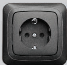
JKL 16-004 - 01 A/J Įleistinis kištukinis lizdas su įžeminimu, be rėmelio Розетка скрытой установки с заземлением