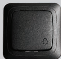
ĮESJ1-10-001 M/J Įleistinis apšvietimo mygtukas, be fiksacijos, naudojamas (laiptinėms su laiko rele), be rėmelio Кнопка освещения, скрытой установки, без фиксации